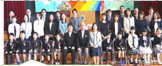
4月6日、10名の1年生を迎え66名でスタートした南が丘小学校

例年ならば運動会があるこの時期ですが、今年度は運動会を含めいろいろな行事が中止または延期になってしまいました。そのような中でも66名の子どもたちは毎日の学習をがんばり、遅れていた学習もほとんどの教科で回復できています。新しい生活様式に対応しながら、63日の登校日を無事終えることができました。