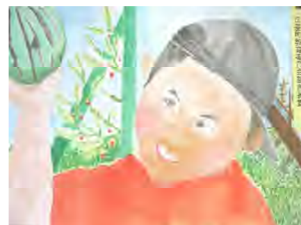
【江差町教育委員会教育長賞】