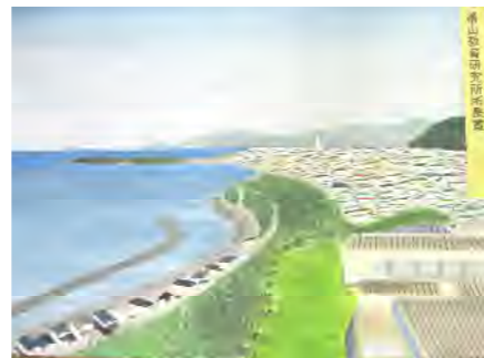
【檜山教育研究所所長賞】

令和3年度第51回檜山管内児童・生徒美術展が開催され、檜山管内の小中学校から多数出品されました。南が丘小学校からも全学年から2作品ずつ出品しました。入賞した児童をご紹介します。入賞おめでとうございます。