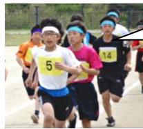
6年生男子 1000mの様子です