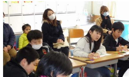
風景。五年生道徳の授業