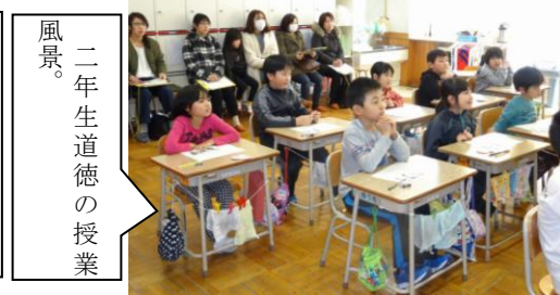
風景。二年生道徳の授業