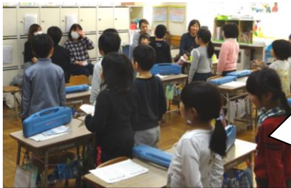
風景。一年生音楽の授業

今年度最後の参観日が2月22日に終わりました。ご多用の中、多くの保護者の皆様のご参観、ありがとうございました。4月と比べて心身ともに成長した子どもたち。4月からは、6年生が中学生へ、1～5年生が、次の学年に進級です。今新たな学年に向けてスタートラインに並ぶ子どもたちの姿、いかがでしたでしょうか？ 下の写真は、参観日の様子です。みんな姿勢よく、授業に集中しています。