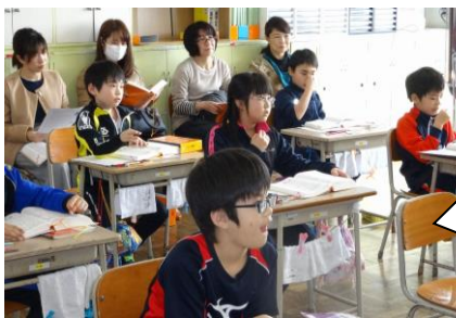
風景。三年生国語の授業