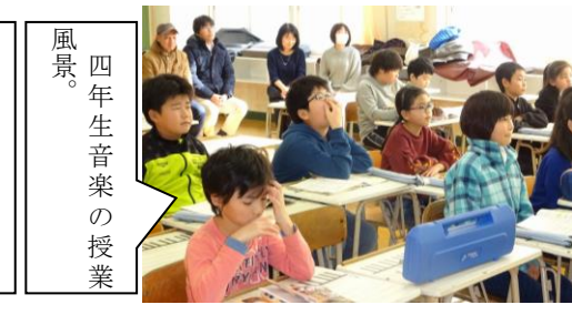
風景。四年生音楽の授業