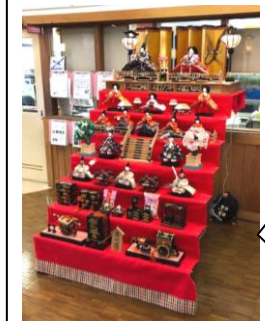
職員室の横に、雛人形が飾られました。