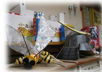
2年生の作品コーナー