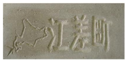
町名と江差町の場所をレンガに

道庁赤レンガ庁舎前庭のアプローチ部分をレンガ舗装し、その約1割は道内の小学生が作成したレンガを使用するプロジェクトがあり、本校の6年生も割り当てられたレンガ3つ分に挑戦しました。