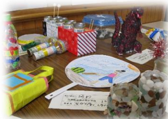
1年生の作品コーナー

教室前や廊下、ホールには、学年ごとに子どもたちの力作がたくさん展示されています。来校された際には、是非ご覧ください。