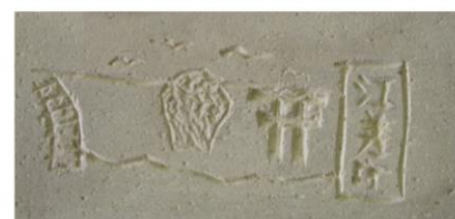
町名と瓶子岩・鳥居をレンガに

アプローチのどの辺りに敷かれていくのかは分かりませんが、道庁赤レンガ庁舎前庭に行く機会がありましたら、是非ご覧ください。