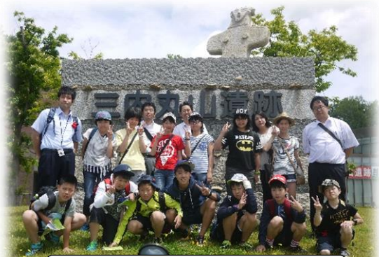
◇三内丸山遺跡の前でポーズ

二日目には、三内丸山遺跡巡りや立佞武多を始め、見学や体験など盛りだくさんでしたが、持ち前のパワーで乗り切りました。他にも実際に見ておきたい場所や体験したいこともあったと思います。一泊二日で味わうには短かったかもしれませんが、素晴らしい思い出をたくさん作ることができたと思います。