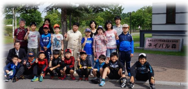
◇ネイバル森の前でポーズ

2日間、親元を離れ、班活動を中心に過ごした子どもたち。一人一人の力が結集されていき、大きな力となって活動を終わることができました。宿泊研修の取組で培ってきた事を今後の学校生活に、そして来年の修学旅行に是非生かしほしいと願っています。