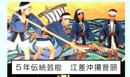
5年伝統芸能 江差沖揚音頭