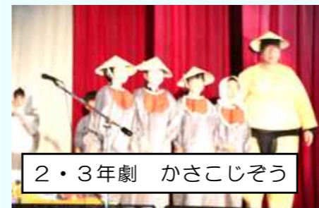
2・3年劇 かさこじぞう