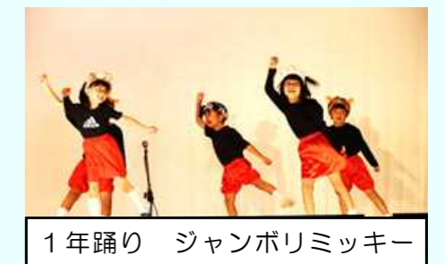
1年踊り ジャンボリミッキー