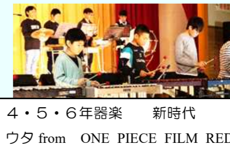
4・5・6年器楽 新時代ウタ from ONE PIECE FILM RED