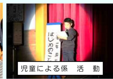
児童による係活動