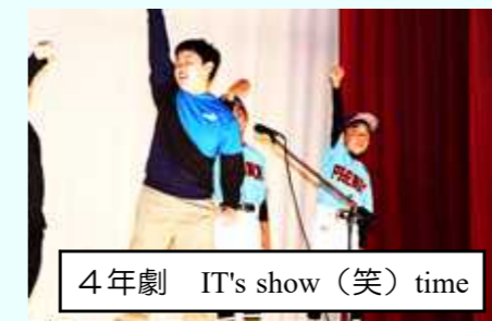
4年劇 IT's show (笑) time