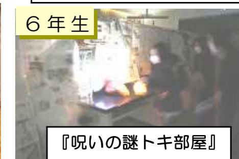
『呪いの謎トキ部屋』