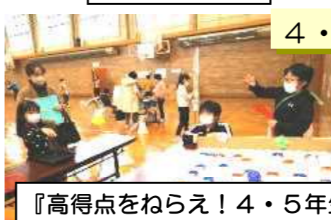
『高得点をねええ！4・5年生運命のボール投げパーク』