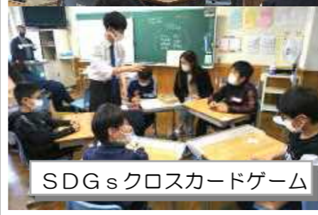
SDGsクロスカードゲーム

学習会では、まずはじめに世界の国々の食卓の写真を見て、世界の食糧事情・環境、人々の現状についてSDGsの視点から見つめ直しました。また、SDGs X (クロス) カードを使い、SDGsを題材にして特定の社会問題を解決し、次のカード（新たな課題）を解決していくイノベーションゲームをグループに分かれて交流しました。今回の学習でSDGsについての知識を深めることができました。