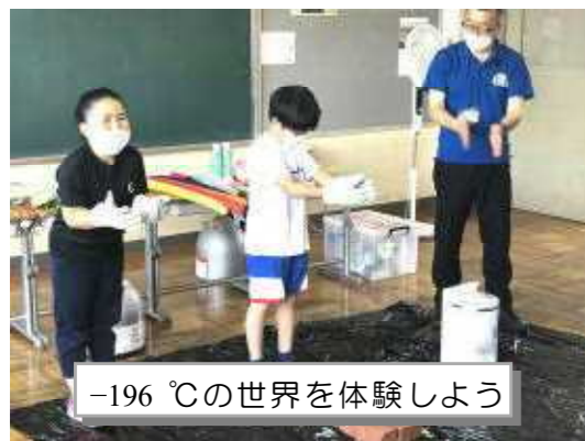
-196℃の世界を体験しよう

6月22日（水）、全校児童を対象とした「移動理科教室」が開催されました。今回、江別にある北海道教育研究所理科センターより科学設備展示自動車（サイエンスカー）に乗って来校して頂き、様々な搭載機器の体験、3D防災シアター、提案授業などを通して科学の楽しさを体験させていただきました。どの授業もワクワク！ドキドキ！心を躍らせる貴重な学習の場となりました。