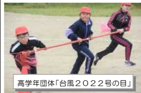
高学年団体「台風2022号の目」