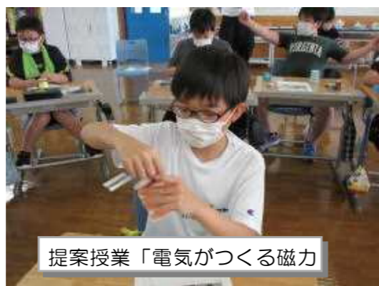
提案授業「電気がつくる磁力」