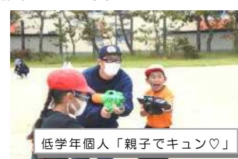
低学年個人「親子でキュン♡」