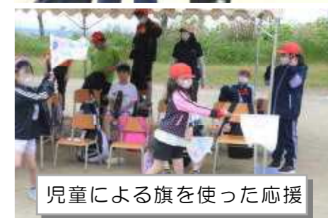
児童による旗を使った応援