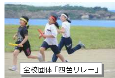
全校団体「四色リレー」