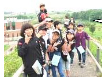
りんご公園での記念撮影です。