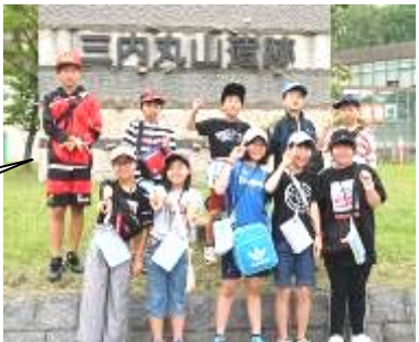
三内丸山遺跡前で記念撮影。