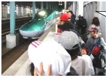
木古内駅から新幹線に乗りました。