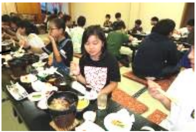
おいしい料理をお腹いっぱい食べました！